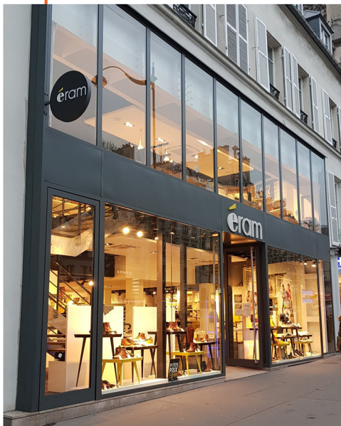
Eram, avenue des Ternes - Paris