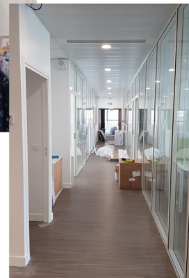
Bureaux - Paris, Ile-De-France