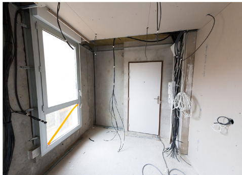
Aménagement de bureaux - Région parisienne

Mougin est spécialiste de l'agencement de bureaux et de magasins. L'entreprise allie création de concept et conception des ensembles mobiliers. La technique et la créativité ne font plus qu'un, pour apporter un supplément d'âme à vos décors.