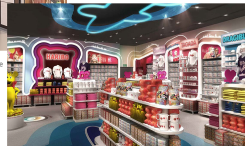
Haribo - Coquelle, Hauts-De-France