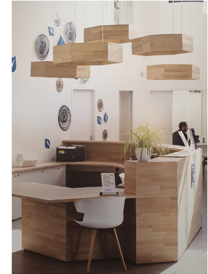
Aménagement de bureaux - Vosges

EVOLUTION PRÉVISIONNELLE DU CHIFFRE D'AFFAIRE EN 2020