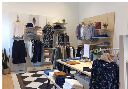
Cyrillus - Bruxelles, Belgique

Après de longues années d'activité, beaucoup d'entreprises nous ont fait confiance pour la réalisation de leurs travaux. Nous prenons plaisir à donner vie à leurs projets, alliant respect du cahier des charges et propositions innovantes.