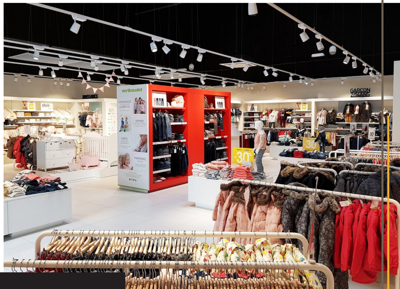
Vertbaudet - Servon, Ile-De-France

Plus de 1000 projets réalisés à vos côtés.