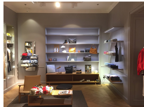
Cyrillus - Levallois, Ile-De-France