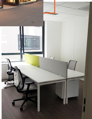
Father & Sons - Montrouge, Ile-De-France

Vous avez un projet d'aménagement d'espace commercial ?